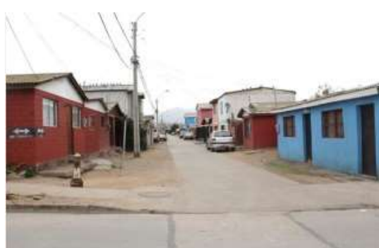
POBLACIÓN ALMIRANTE WILLIAMS

La caracterización socioeconómica en Guayacán es la siguiente: D (83%) - C3 (13%) - E (5%), según la información proporcionada por estudio Serviu ( https://eae.mma.gob.cl/storage/documents/04_Anteproyecto_PRC_Coquimbo_Guayacancito.pdf ).